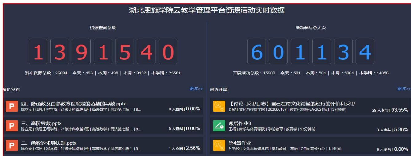
图2 云教学平台资源活动实时数据

图2显示：显示本时点教学资源查阅总数 1391540 人次，活动参与 601134 人次。