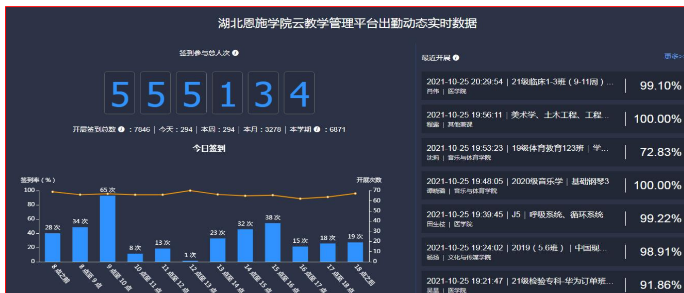
图3 云教学平台出勤动态实时数据