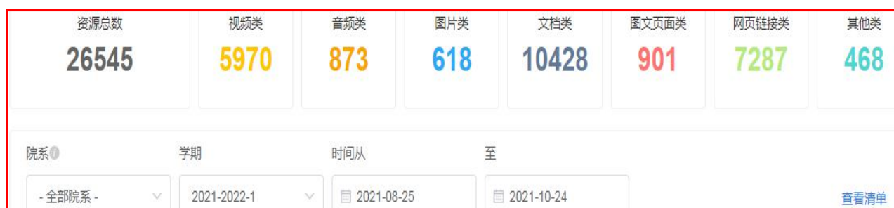
图 7 云班课资源情况

图 7 显示:蓝墨云班课资源总数及种类、数量情况:资源总数 26545 (视频类 5970, 音频类 873, 图片类 618, 文档类 10428, 图片页面类 901, 网页链接类 7287, 其他类 468)。