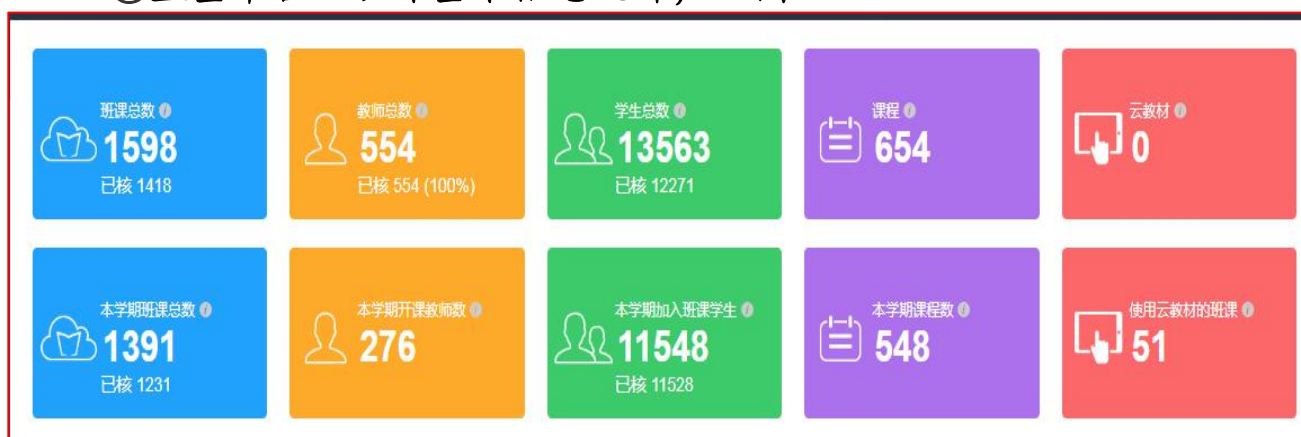
图 1 蓝墨平台云班课基本信息统计