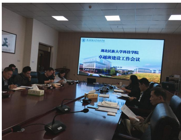
图1 学校卓越班建设工作研讨会

目标达成度: 制定了《湖北民族大学科技学院卓越班导师制实施办法》。教务处三次组织各二级学院召开了专题会议，卓越班建设秉承我校“正德至善、为学至精”的校训精神，旨在培养更多专业本领过硬、文化知识扎实、就业竞争力更强的高层次应用人才，就卓越班建设的类型、模式、对象、选拔时间、课程设置等进行了广泛讨论。