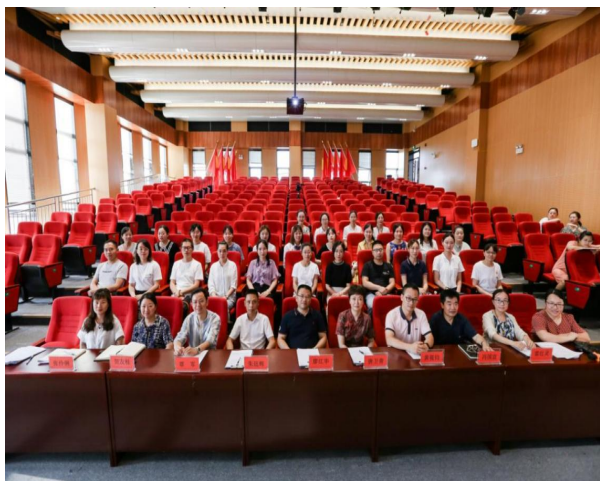
图5 参赛选手与评委合影