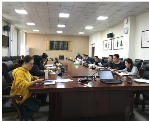
图2 学校卓越班建设推进会